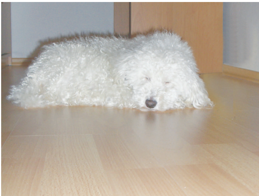
Pohodlie pre každého