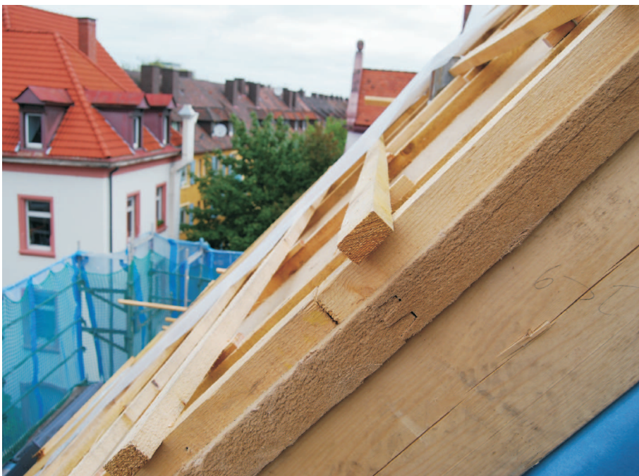
Istota s garanciou